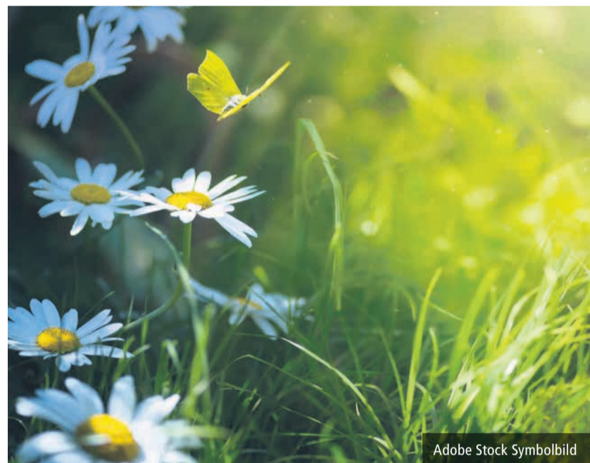
Adobe Stock Symbolbild