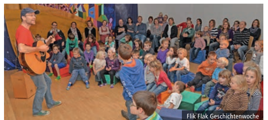
Flik Flak Geschichtenwoche