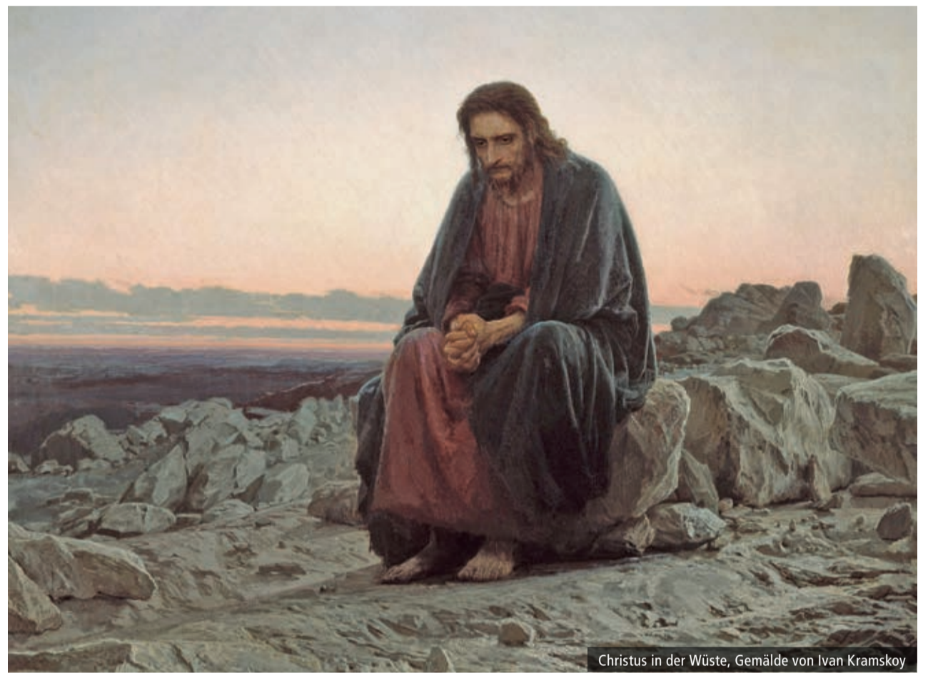
Christus in der Wüste, Gemälde von Ivan Kramskoy