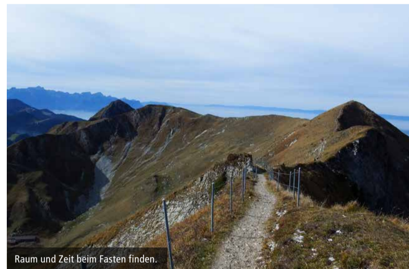
Raum und Zeit beim Fasten finden.

Mit Leib und Seele stellen wir uns darauf ein, die Nahrung für eine überschaubare Zeit nicht von aussen, sondern von innen zu beziehen. Wir verzichten auf feste Nahrung und Genussmittel, kommen nach und nach zu uns selbst und gewinnen Raum und Zeit für unsere Mitmenschen und unsere Gottesbeziehung.